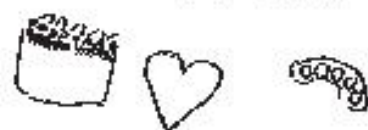
イラスト・コメント K・Tさん