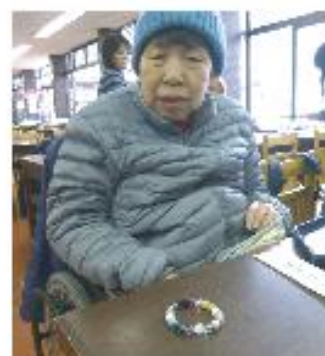
Yさん ブレスレットできました★