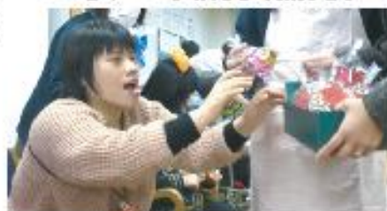
Iさん ゼッゼッ、ぜんぶちょうだい♪