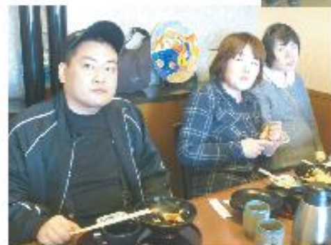
Yさん おいしいなあ〜♪ Iさん

2日目の海遊館では、優雅に泳ぐ巨大なジンベイザメや、すいすい泳ぐイルカなどを見て「大きいなあ〜」「気持ちよさそうやなあ！」などと話しながら、皆さん興味津々のご様子で見られました。あっという間の一泊二日でしたが、楽しい旅行となりました。