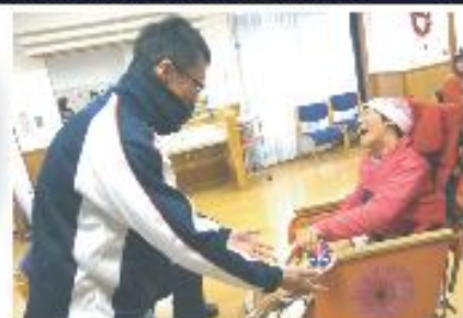
Hさん ♪わたしの気持ち♪