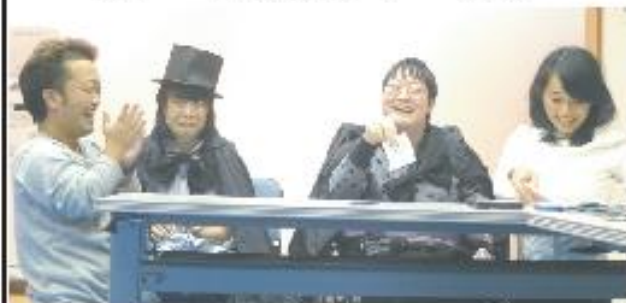
Iさん マワック大成功〜！！ Yさん