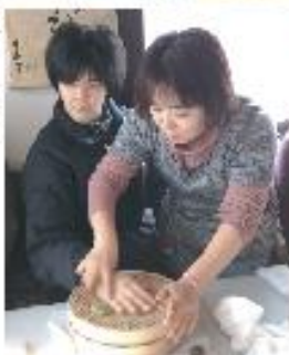
Hさん 早く食べたいな♪